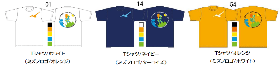
Tシャツ/ホワイト (ミズノロゴ/オレンジ)