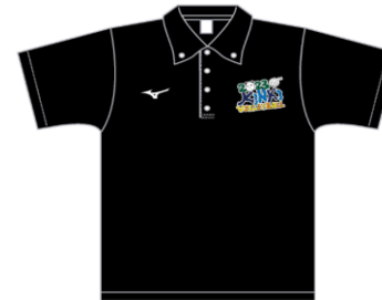
ポロシャツ/ブラック (ボタンダウン仕様) (ミズノロゴ/ホワイト)